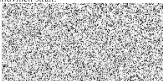
jednatel Požární bezpečnost s.r.o.