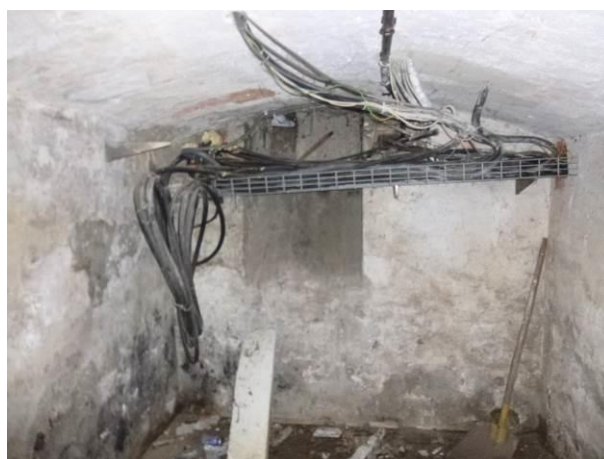
objekt soc.zařízení pro veřejnost