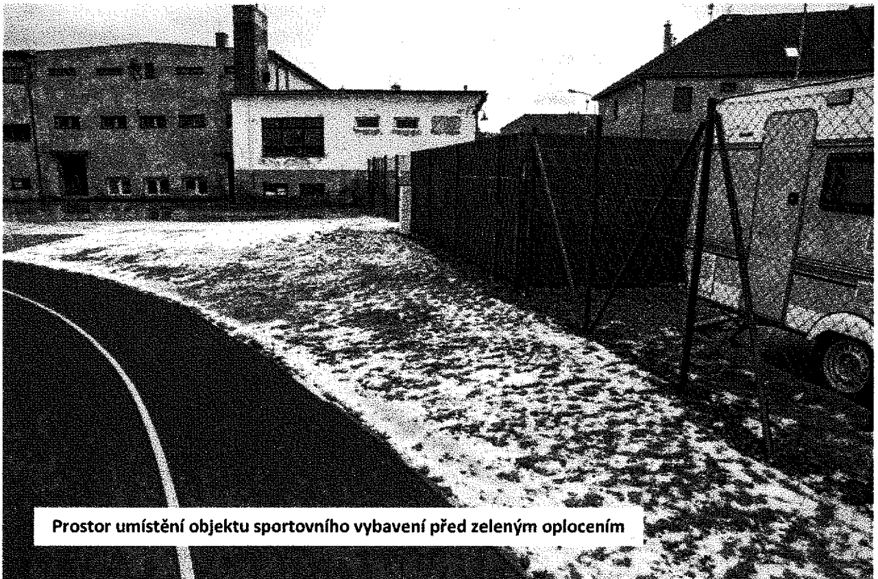
Prostor umístění objektu sportovního vybavení před zeleným oplocením