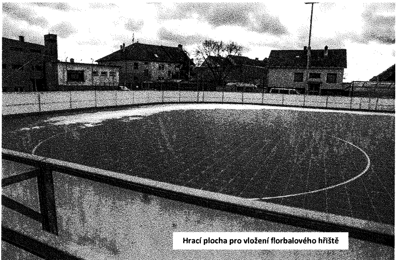
Hrací plocha pro vložení florbalového hřiště