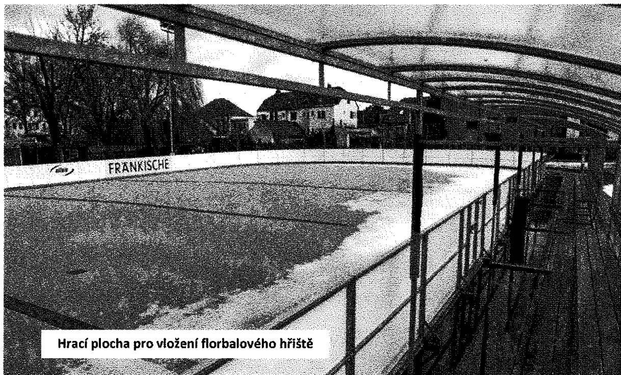
Hrací plocha pro vložení florbalového hřiště