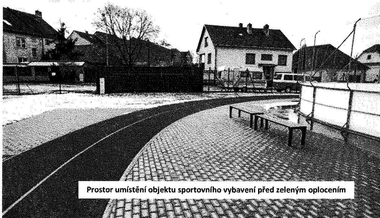
Prostor umístění objektu sportovního vybavení před zeleným oplocením