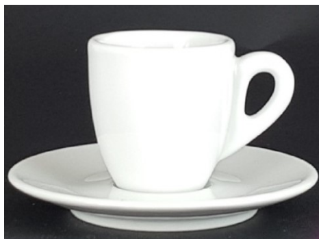
typ S CLAIRE