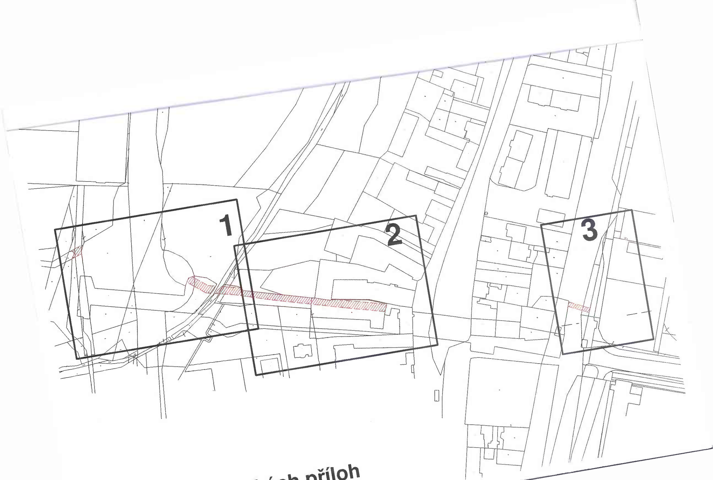
Přehledka grafických příloh