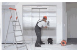
Servis 24 hodin