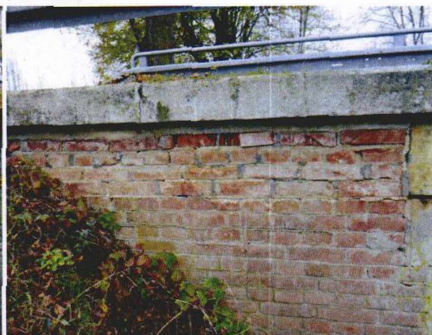
křídlo na začátku vpravo