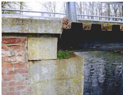
bok opěry na začátku vpravo