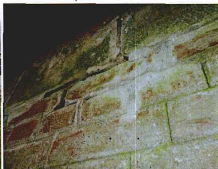
opěra na začátku mostu