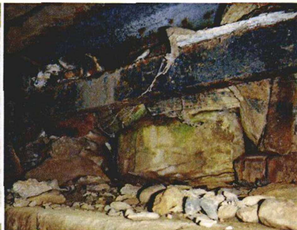
závěrná zídka na konci