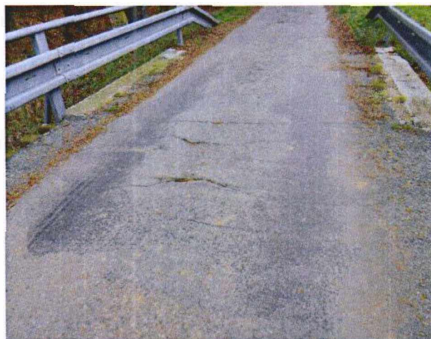
trhliny na konci mostu