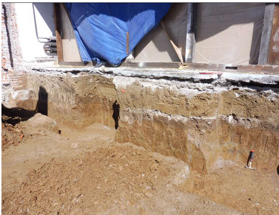
Obr. 2: Pohled na základovou spáru pod základovým pasem nového štítu ZP 3.

Hodnotu tabulkové výpočtové únosnosti ve smyslu již neexistující normy ČSN 73 1001 Základová půda pod plošnými základy lze pro jíly, tuhé konzistence, s opracovanými úlomky podložních hornin o velikosti do 1 cm, tvořící základovou spáru pod základovým pasem nového štítu s označením ZP 3, uvažovat v minimální hodnotě R_{dt} = 150 \text{ kPa} .