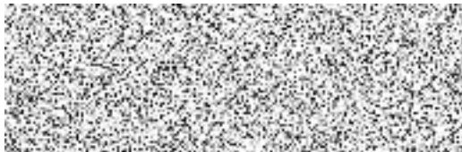
Domov mládeže a školní jídelna Pardubice ubytovatel