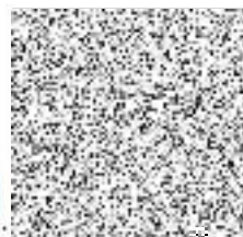
Libor Lesák radní