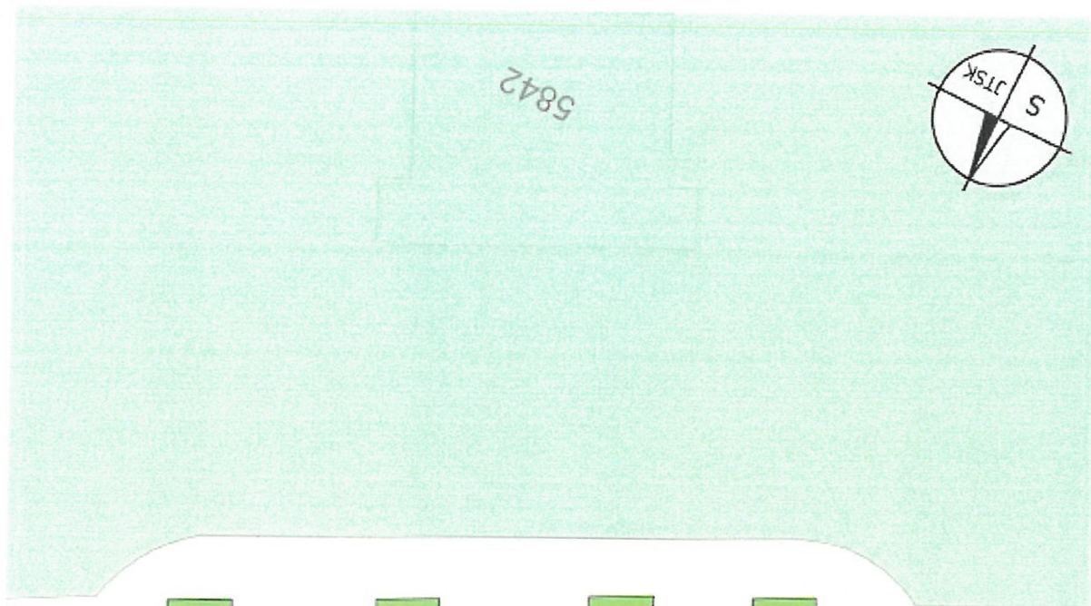
Příloha č. 1 situační pláněk