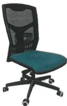
14 ks bez područek