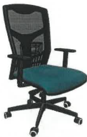
21 ks s područkami