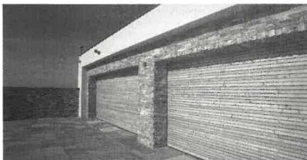
Schéma garážových vrat

Na garážová vrata Vám můžeme nabídnout možnost prodloužené záruky na 11 let. Předpokladem jsou každoroční servisní práce.