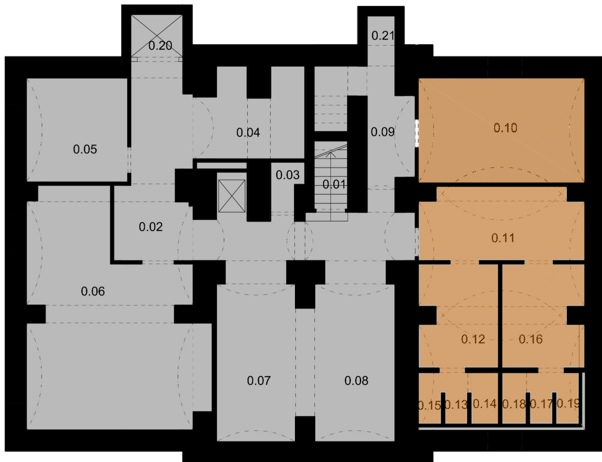
Schematický půdorys 1.PP