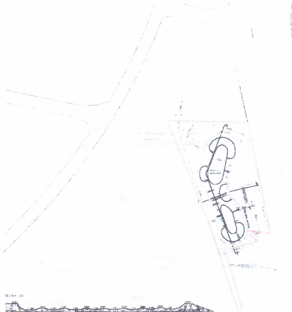
REZ A-A 1:200