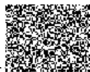
za kupujícího Vladimír Šebesta vedoucí automobilního oddělení