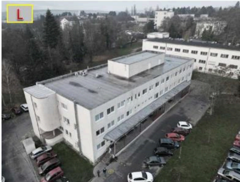
a) Fotografie střechy objektu