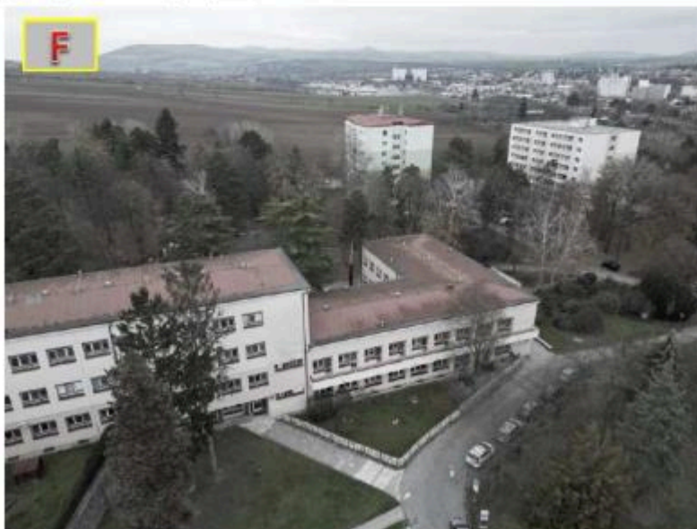
a) Fotografie střechy objektu