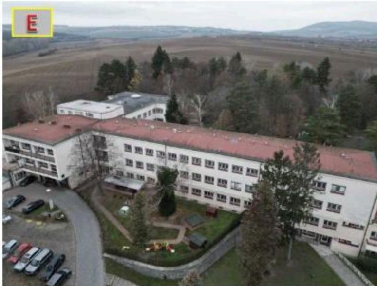
a) Fotografie střechy objektu