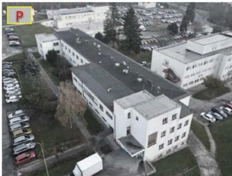
a) Fotografie střechy objektu