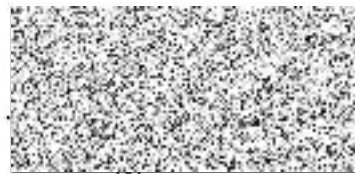
děkan příjemce dotace