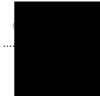
..... h.D. ha

Ředitelství silnic a dálnic ČR, státní příspěvková organizace