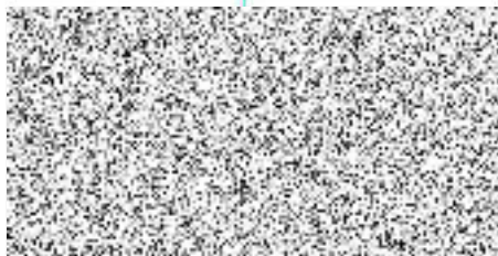
ředitelka ŽT, a.s.

Finanční úřad pro Ústecký kraj Generální finanční ředitelství Oddělení hospodářské správy