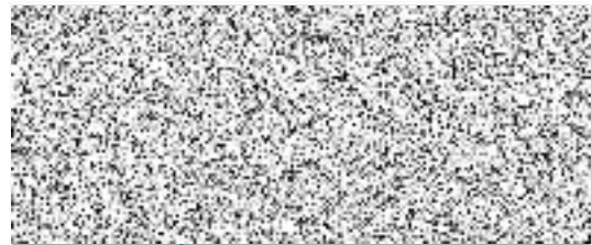
Plavecká škola Jihlava s. r. o. (dodavatel)