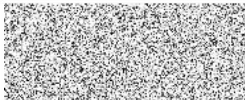
Plavecká škola Jihlava s. r. o. (dodavatel)