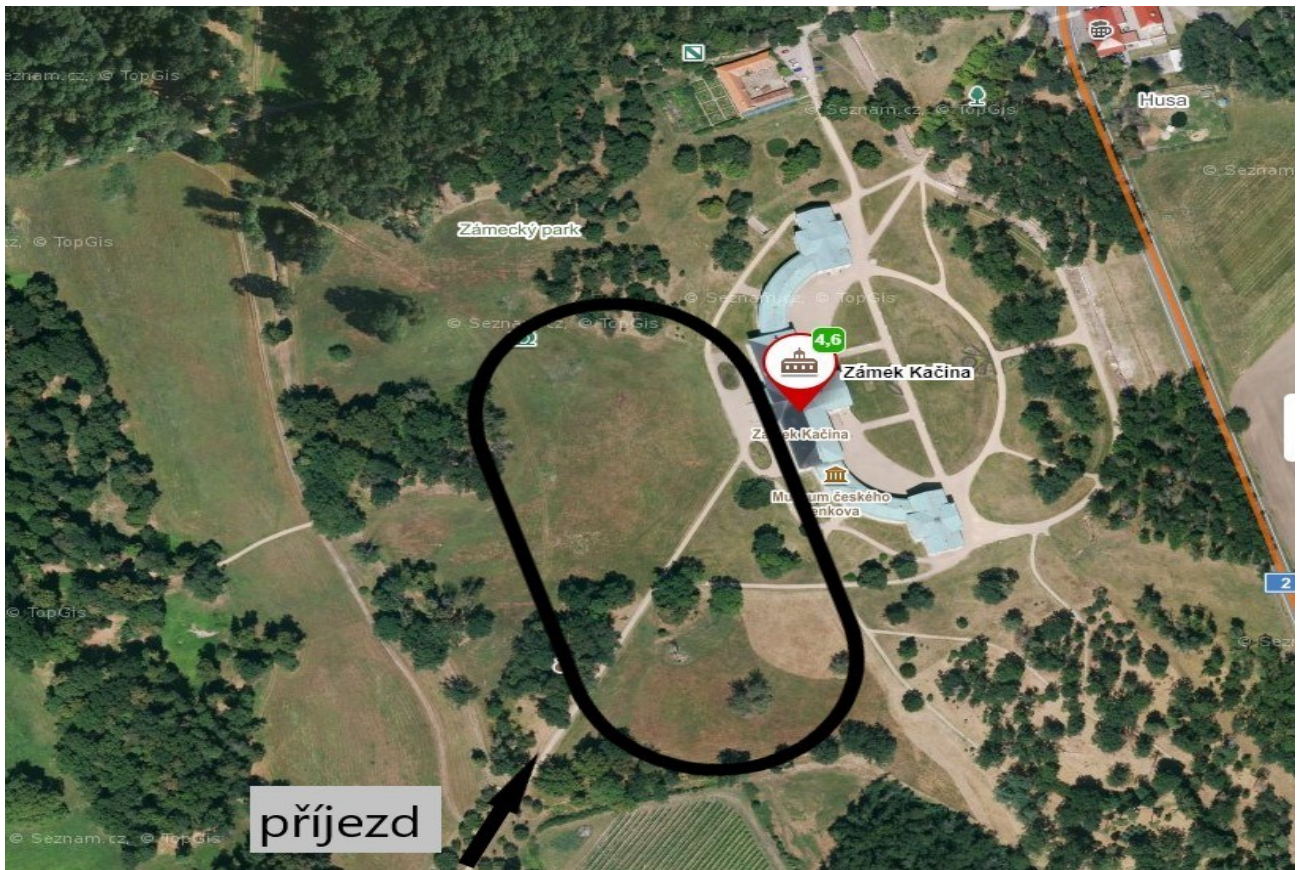
Příloha č. 2: Zabezpečení požární ochrany v areálu zámku Kačina