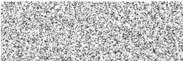
jméno, příjmení a podpis osoby pověřené pojistitelem uzavřením pojistné smlouvy

Příloha: 0 listů s vlastníky anebo držiteli vozidel