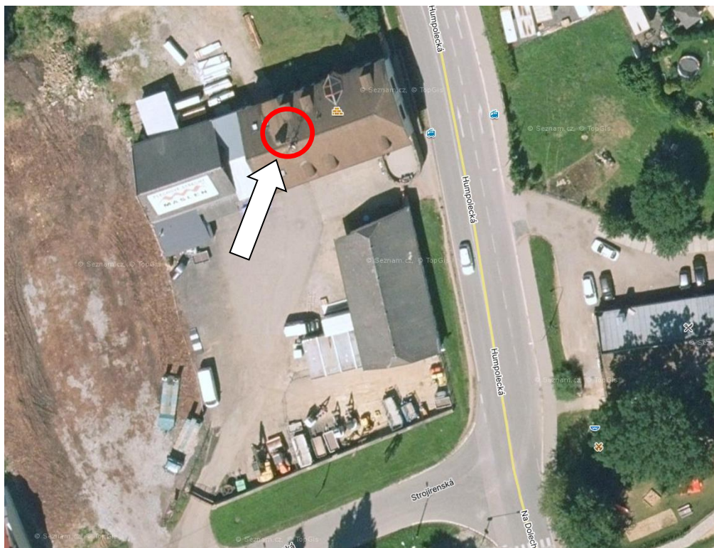
Pozice vysílače M – SOFT na střeše objektu Humpolecká 1