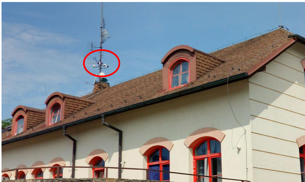
Pohled na internetový vysílač M – SOFT z ul. Humpolecká