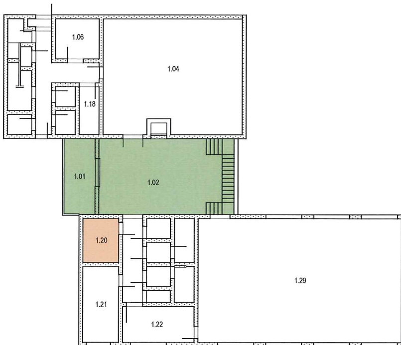
SO 101 - 1.NP