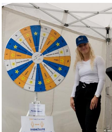
Obrázek č. 1 – kolo štěstí: