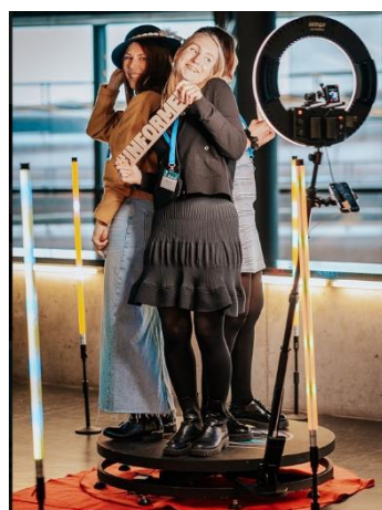
Obrázek č. 5–360° fotokoutek:

Podrobná technická specifikace produktu, který Dodavatel pro Zadavatele zakoupí a popis rekvizit jsou popsány níže v bodě 4.1. Zadavatel předá dodavateli zpracovanou grafiku do videa. Bude se jednat o nákup jedné kompletní sady k 360 video.