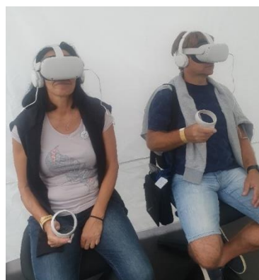
Obrázek č. 2 – virtuální realita: