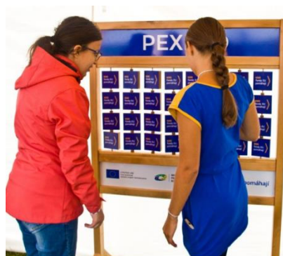
Obrázek č. 4 – dřevěné pexeso: