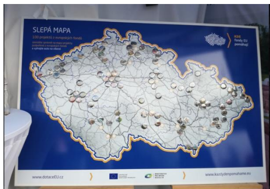
Obrázek č. 3 – slepá mapa: