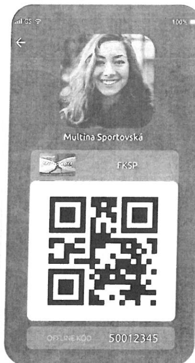
Karta MultiSport FKSP