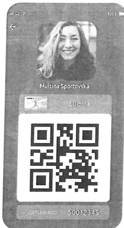
Karta MultiSport Stříbrná