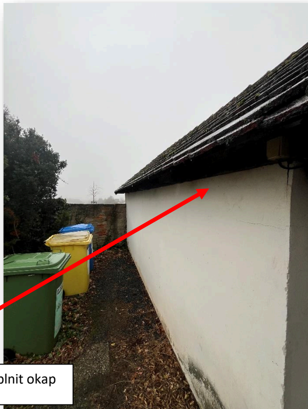
Zde je nutné doplnit okap