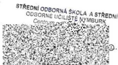
razítko a podpis