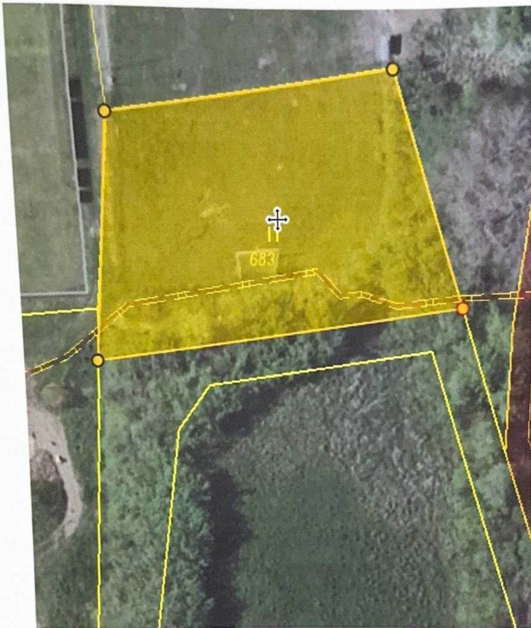
Poloha věcného břemene ve prospěch ČEZ Distribuce, a.s.