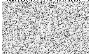
správa ostatních nemovitostí PRAHA 10 - Majetková, a.s.

Pokud zhotovitel zjistí, že cena dodávky bude vyšší než cena uvedená na objednávce, musí o této skutečnosti informovat objednatele a ten musí tuto vyšší cenu písemně odsouhlasit. Práce dle této objednávky jsou provedeny řádně, pokud jejich provedení odpovídá podmínkám stanoveným touto objednávkou, dohodou smluvních stran či příslušnými, hygienickými a jinými