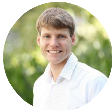
Founder & CSO