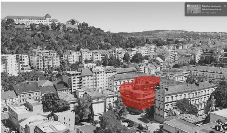
Foto z Google earth, ideálně z dronu