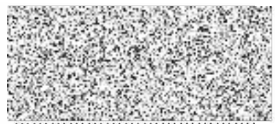
datum potvrzení a podpis dodavatele (razítko)

Česká republika Hasičský záchranný sbor Královéhradeckého kraje nábřeží U Přívozu 122/4 500 03 Hradec Králové IČ: 70882525 CZ-NUTS: CZ0521 48