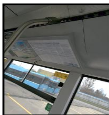
Obrázek č. 14 Umytí stropních reklamních ploch