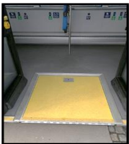
Obrázek č. 19 Umytí krytu topení na boční stěně