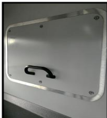
Obrázek č. 12 Umytí bočních ploch