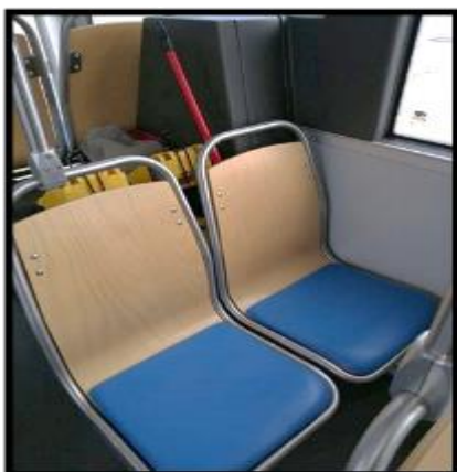
Obrázek č. 21 Umytí opěradel sedadel