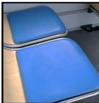
Obrázek č. 22 Umýt sedadlovou část