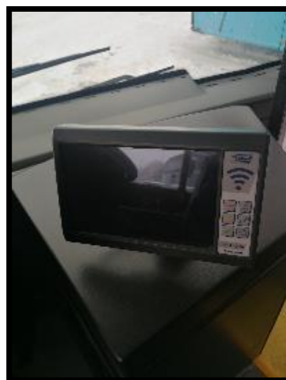
Obrázek č. 10 Display palubního systému