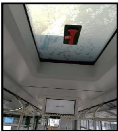
Obrázek č. 11 Mytí stropu, stropního okna a LCD monitorů