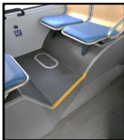
Obrázek č. 18 Umytí prostoru pod sedadly