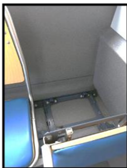
Obrázek č.4 Úklid za sedadly zadní řada