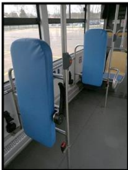
Obrázek č. 23 Umýt opěradla pro vozičkáře