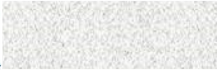
prezident Svazu vinařů ČR