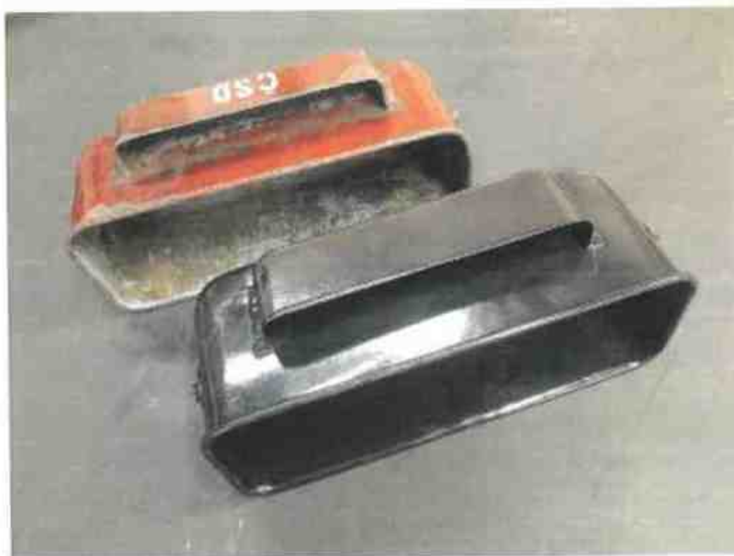
Jiný pohled na koše.