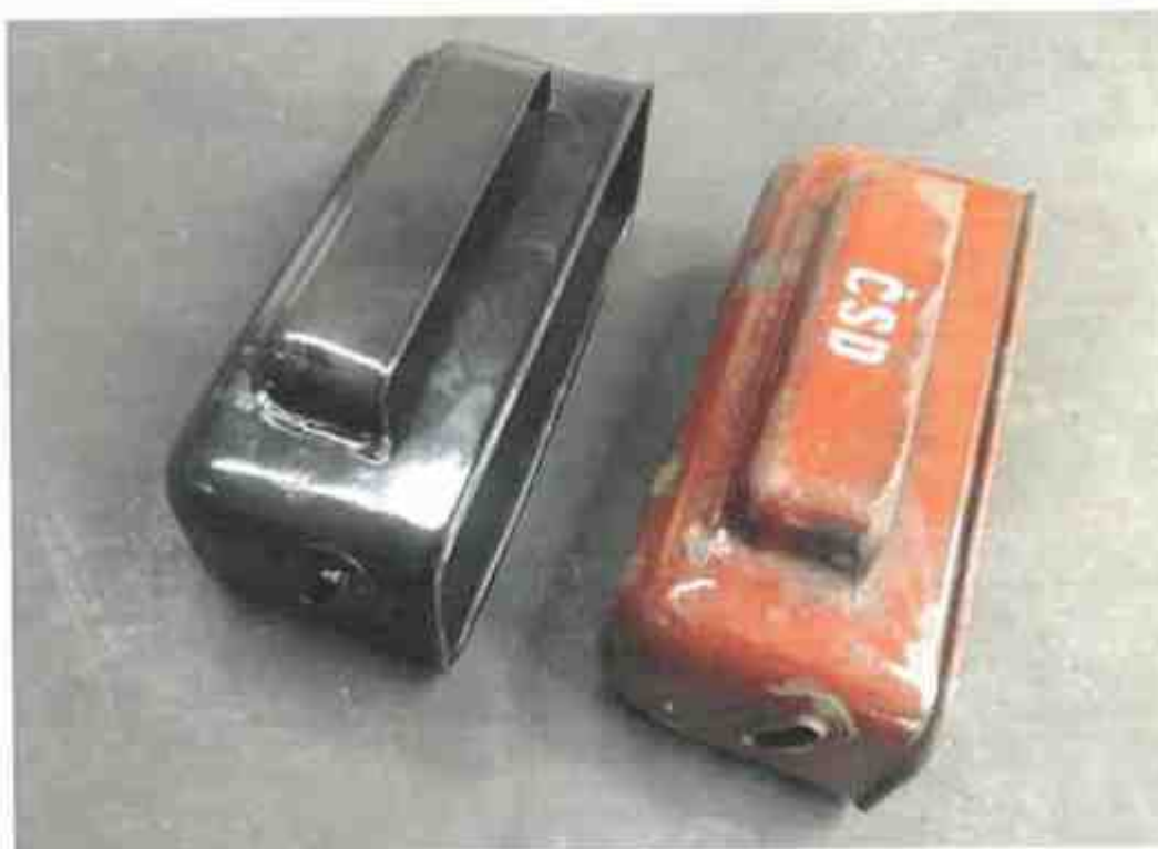
Vlevo koš v základním smaltu.