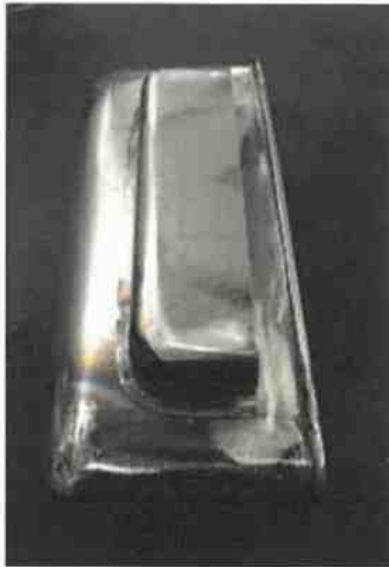
Pohled na boční kapsu.