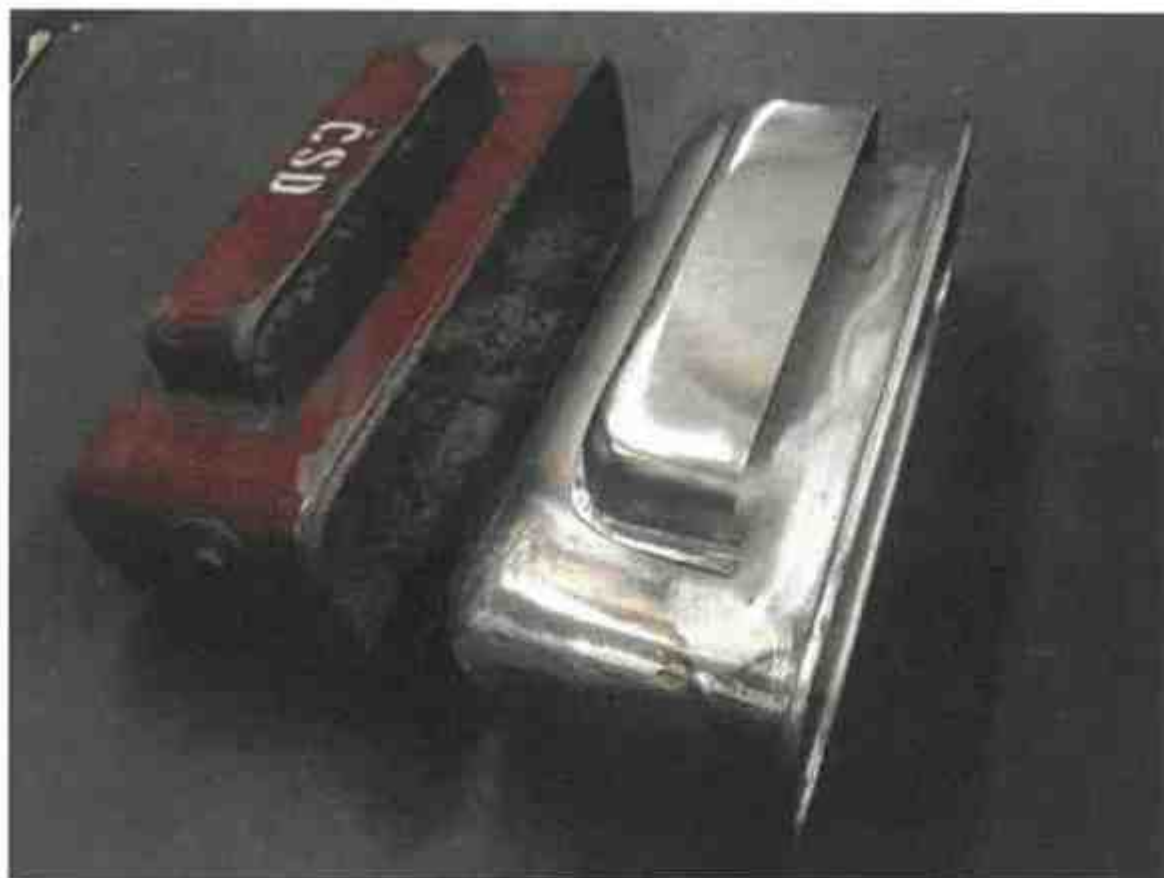
Pohled na provedenou zkoušku.