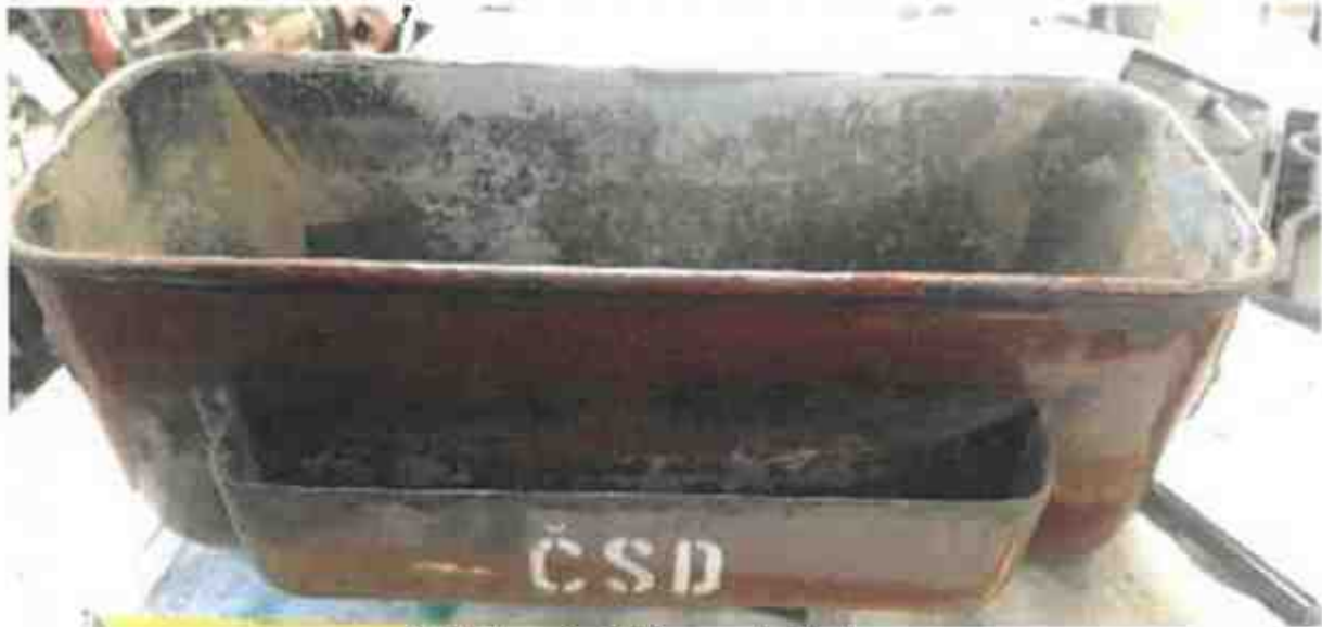
Pohled na originální provedení koše.

ZADÁNÍ: vytvořit cenovou rozvahu na základě originálního koše s popelníkem a původního výrobního výkresu z roku 1926.