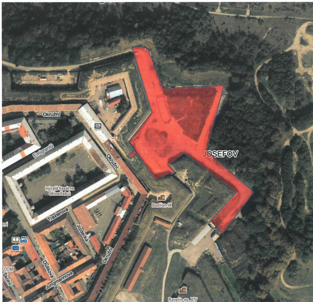
Příloha č. 1 Smlouvy o krátkodobé výpůjčce MAJ/OMM-0537/2023 - situační pláněk s vyznačením předmětu výpůjčky