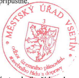
Bc. Ludmila Rejmanová referentka odboru územního plánování, stavebního řádu a dopravy