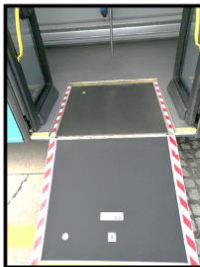
Obrázek č.2 Úklid prostoru pod vyklopenou plošinou