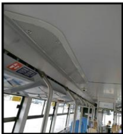
Obrázek č. 13 Umytí stropních krytů klimatizace