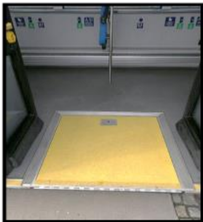
Obrázek č. 19 Umytí krytu topení na boční stěně