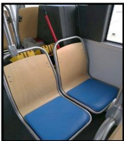
Obrázek č. 21 Umytí opěradel sedadel