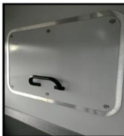
Obrázek č. 12 Umytí bočních ploch