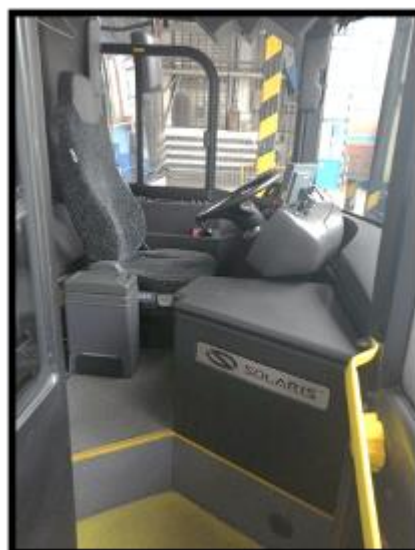
Obrázek č. 8 Umytí a vyleštění skel