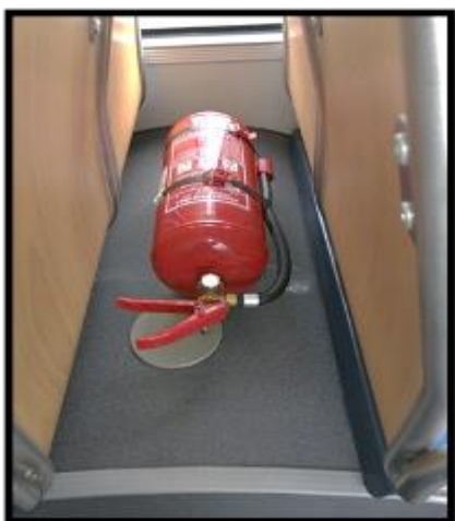
Obrázek č. 17 Umytí prostoru mezi sedadly