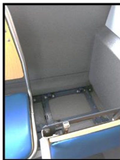
Obrázek č.4 Úklid za sedadly zadní řada