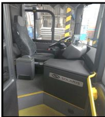
Obrázek č. 24 Mokré čištění sedadla řidiče