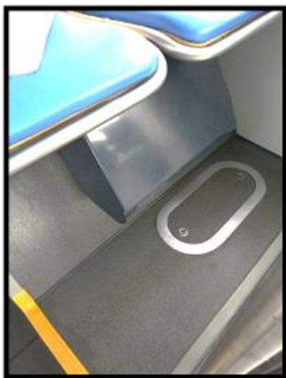
Obrázek č.3 Úklid podlahy pod sedadly