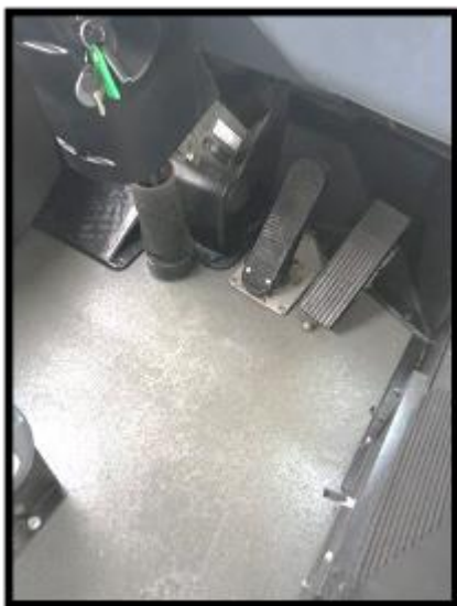
Obrázek č. 5 Úklid podlahy v kabině řidiče