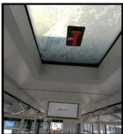
Obrázek č. 11 Mytí stropu, stropního okna a LCD monitorů