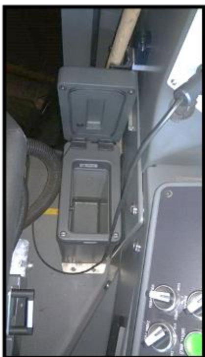
Obrázek č. 9 Umytí ledničky řidiče