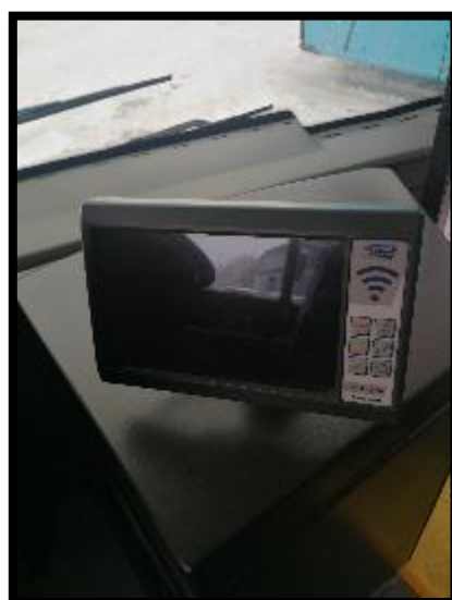
Obrázek č. 10 Display palubního systému