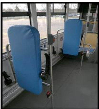
Obrázek č. 23 Umytí opěradla pro vozíčkáře