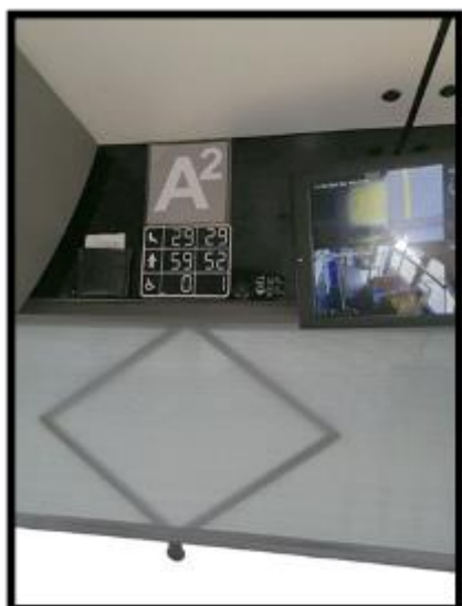
Obrázek č. 7 Umýt plochu nad čelním oknem včetně displeje kamerového systému