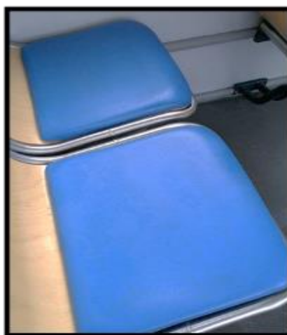
Obrázek č. 22 Umytí sedadlovou část