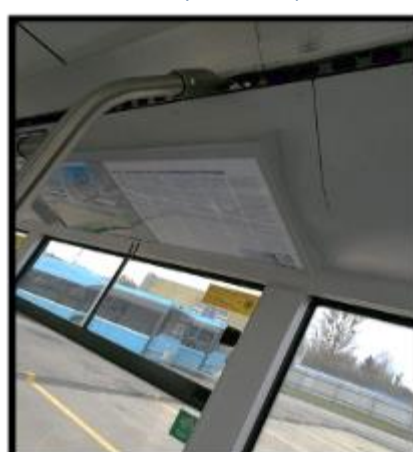
Obrázek č. 14 Umytí stropních reklamních ploch