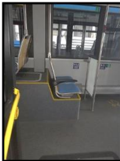
Obrázek č. 16 Umytí skleněných přepážek