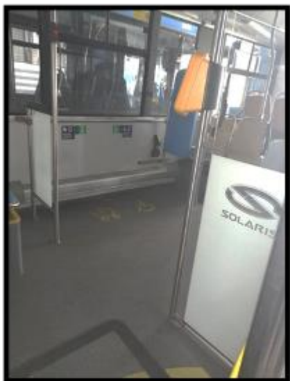
Obrázek č. 15 Umytí skleněných přepážek, validátorů