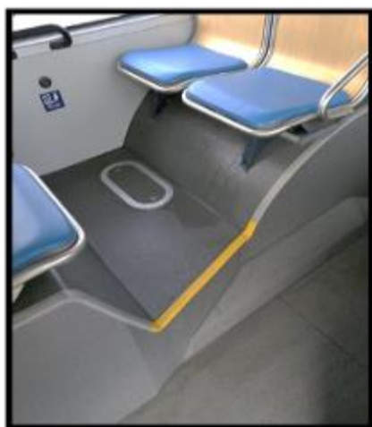
Obrázek č. 18 Umytí prostoru pod sedadly