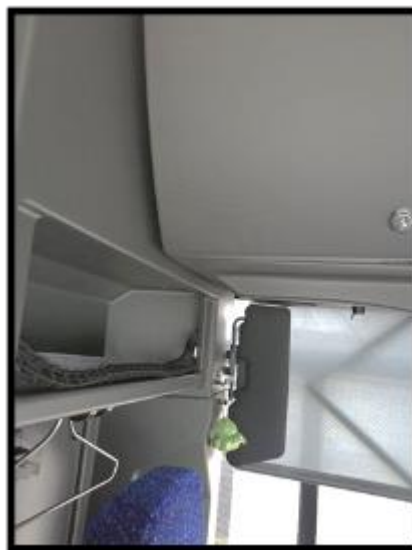
Obrázek č. 6 Úklid prostoru kabiny řidiče