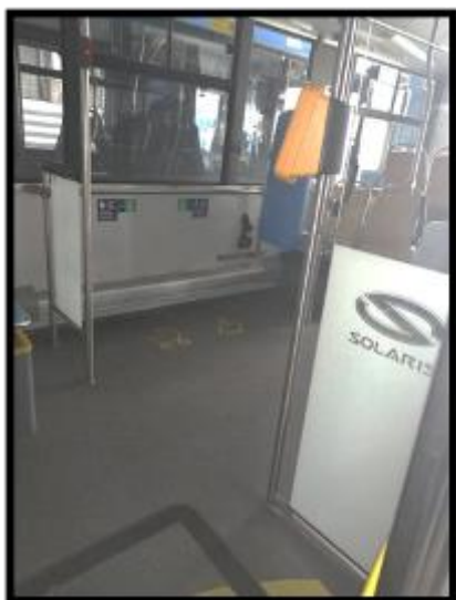
Obrázek č.1 Odstranění hrubých nečistot