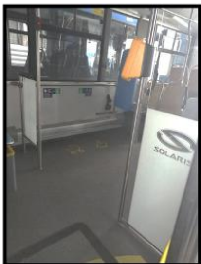
Obrázek č.1 Odstranění hrubých nečistot