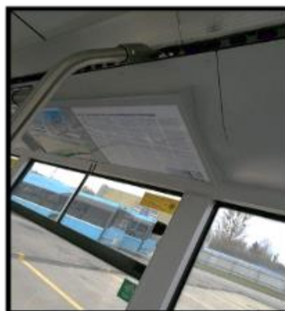
Obrázek č. 14 Umytí stropních reklamních ploch