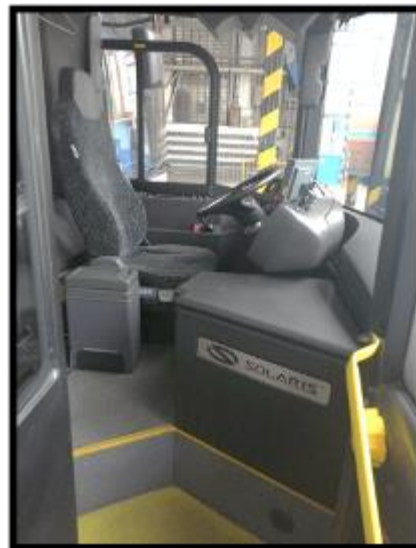
Obrázek č. 6 Úklid prostoru kabiny řidiče