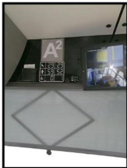
Obrázek č. 7 Umýt plochu nad čelním oknem včetně displeje kamerového systému