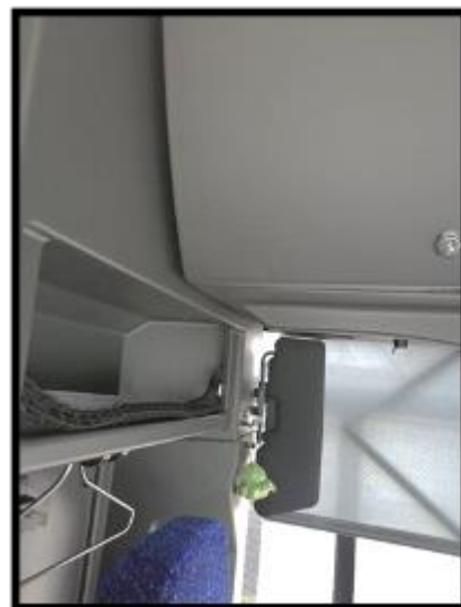
Obrázek č. 8 Umýtí a vyleštění skel