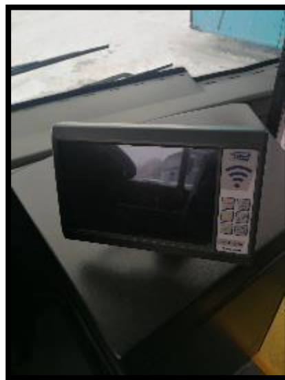
Obrázek č. 10 Display palubního systému