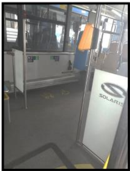
Obrázek č. 15 Umytí skleněných přepážek, validátorů