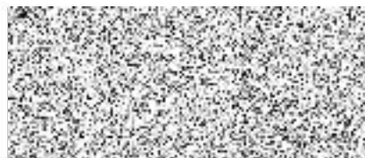
za příjemce brig. gen. Ing. Radim Kuchař ředitel HZS Moravskoslezského kraje

Tuto smlouvu je v době nepřítomnosti hejtmana kraje oprávněn podepsat jeho zástupce v pořadí určeném usnesením zastupitelstva kraje č. 1/10 ze dne 5. 11. 2020, ve znění usnesení č. 12/1193 ze dne 8. 6. 2023.