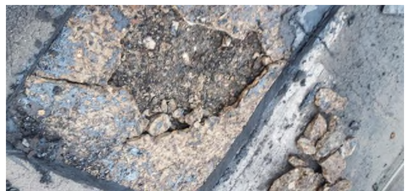
Dodatečné lemování - přechod střecha/stěna