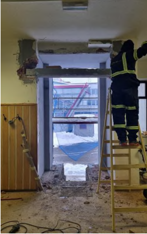
Překlád + vstupní dveře