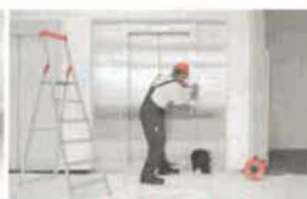
Servis 24 hodin