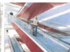
Eskatátory & pohyblivé chodníky