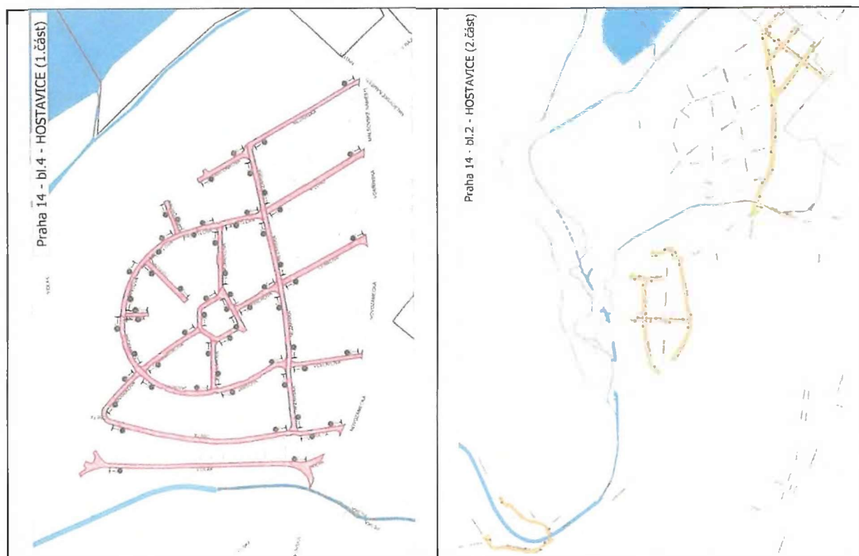
Obr. 2. Vybrané komunikace v oblasti Hostavice.