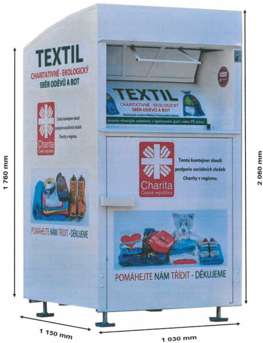
Schéma kontejneru na textil