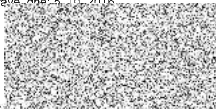
dodavatel razítko a podpis zástupce