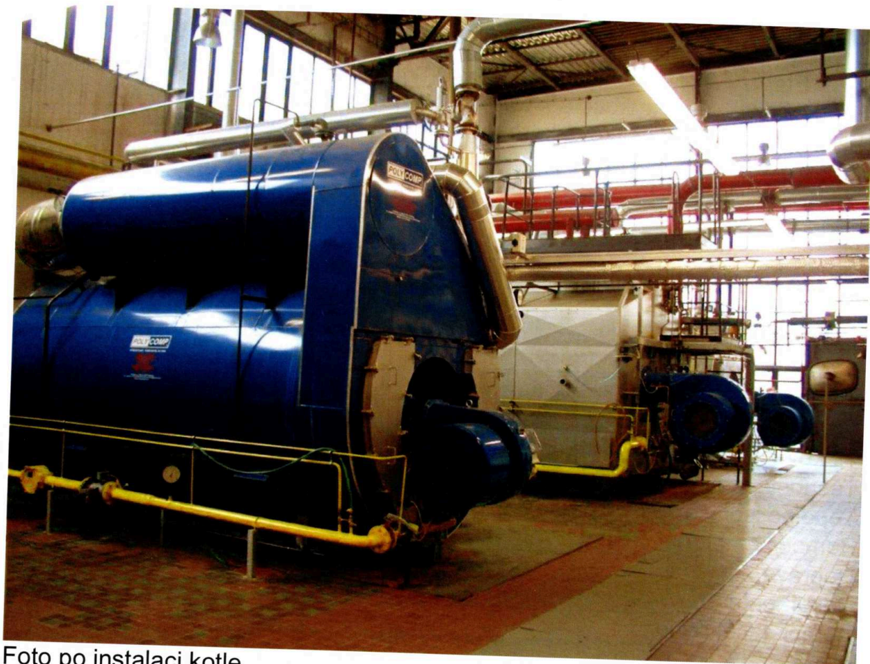
Foto po instalaci kotle

Na základě poptávky č.j. 10/24 a osobní prohlídce kotle KU 4000 ve 3 /2024 - (tekoucí trubky přehříváku) navrhuji provedení opravy kotle po etapách – 1.etapa – výměna přehříváku. Zároveň je možné použít pro rozhodování o finanční náročnosti instalace nového kotle nebo provedení GO kotle.