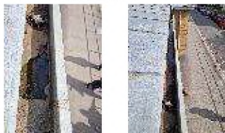
stav okapu 1.jpgstav okapu 2.jpg

Dobrý den paní [REDACTED] stávající okapový žlab je navržený jako dvouplášťový. Okap je složen z vrchní krycí části okapu, která tvoří pohledovou část a z vnitřní části okapu, která tvoří spád pro odtok dešťové vody.